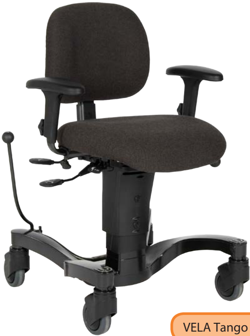
VELA Tango 700