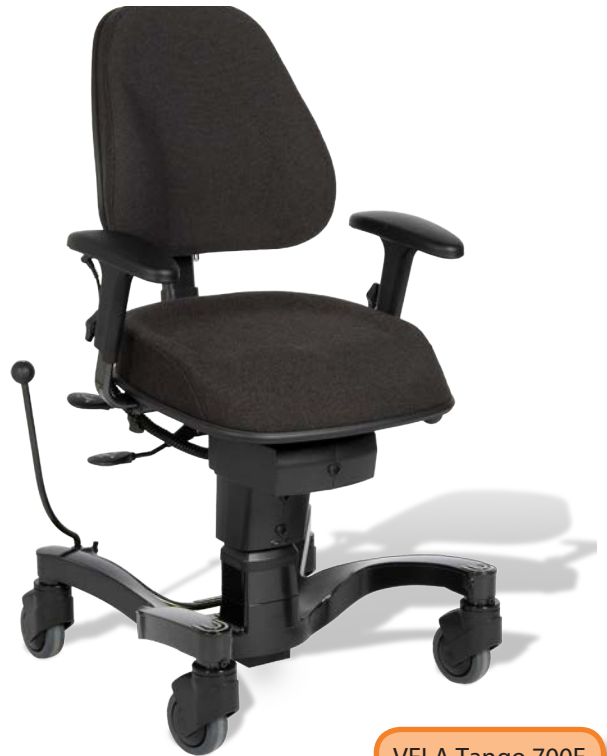
VELA Tango 700E